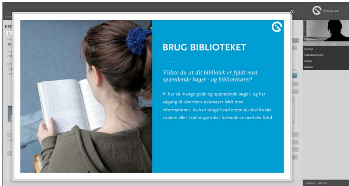
Preview af indholdet fra ovenstående billede

Den brugervenlige opbygning med 11 skabeloner er tidsbesparende i hverdagen, da redaktøren meget effektivt kan ændre eller tilføje indholdselementer, så det skaber dynamik i galleriet.