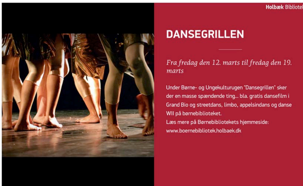
Eksempel fra Holbæk Bibliotek

Når du vælger storskærme som formidlingsværktøj, er det vigtigt, at det visuelle udtryk er på et højt niveau for at fange brugernes opmærksomhed positivt. Hos InfoGalleri er vi eksperter i at sørge for, at det grafiske design på skærmene forbliver flot og fængende. Det er vigtigt at beholde en vis konsistens i sin formidling og sit udtryk, og derfor vil vi i tæt samarbejde med jer udarbejde jeres visuelle identitet, så I kan blive "brandet" på den mest effektive måde.