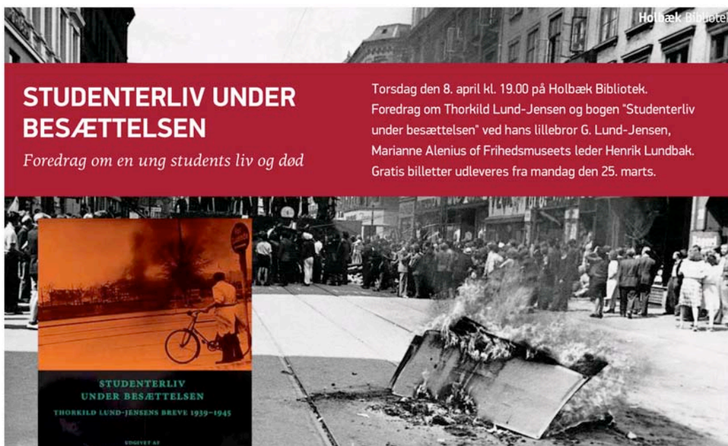
Et andet eksempel fra Holbæk Bibliotek, hvor der bruges en anden skabelon men med det gennemgående tema (logo og farve)