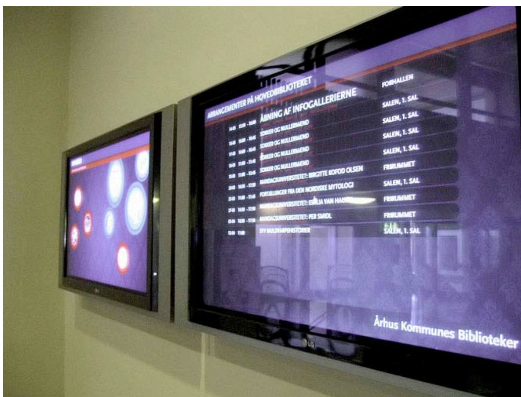
Bibliotekerne bruger også gallerierne til at vise de arrangementer, der foregår i huset.